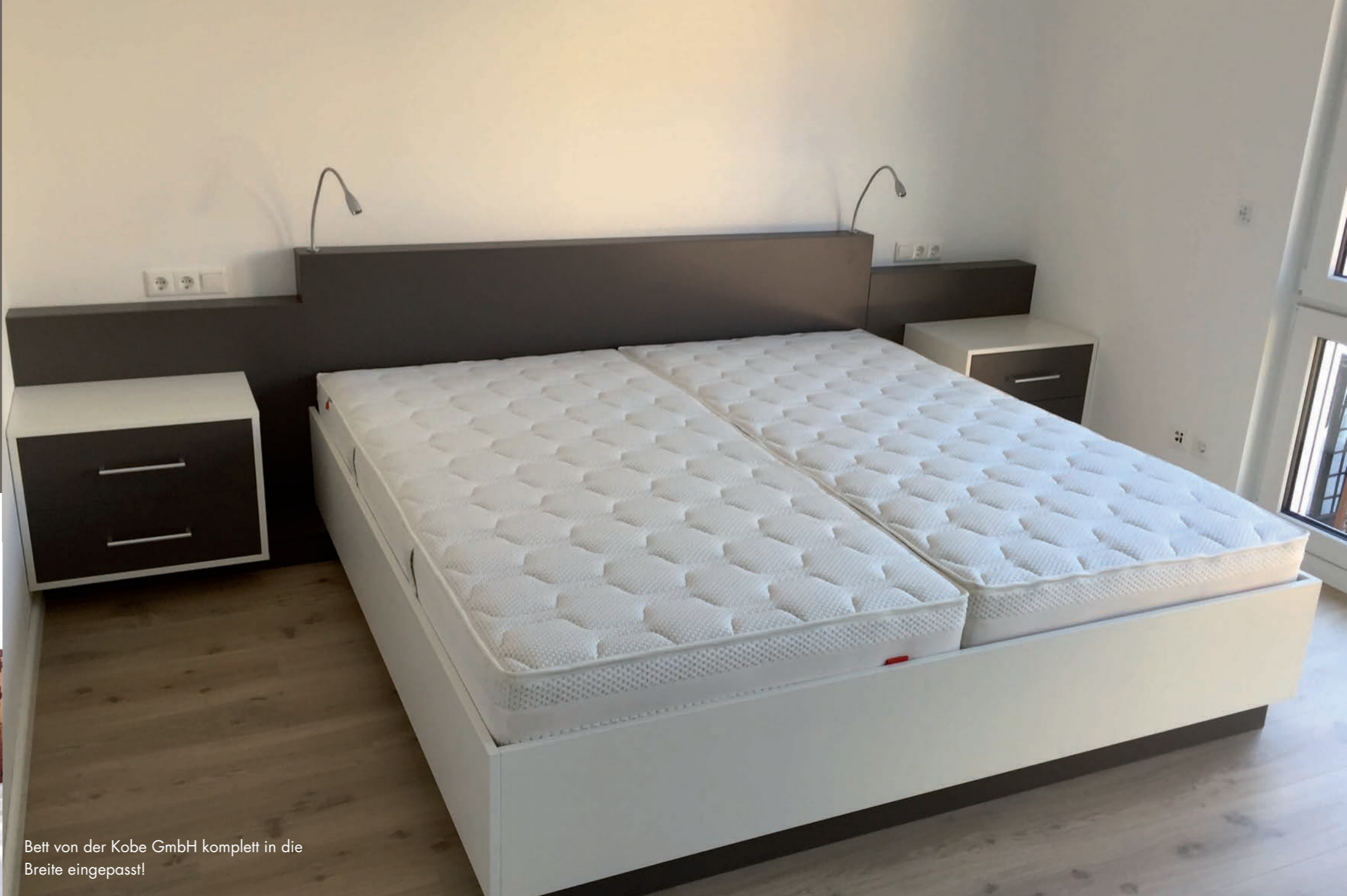
Bett von der Kobe GmbH komplett in die Breite eingepasst!